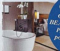
Zimmer im Westin Grand München

GOODIE Gewinnen Sie ein BEAUTY-VERWÖHN-PAKET von body point im Wert von 900 Euro