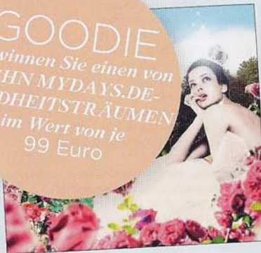
Die Themenwelt „Kindheitsträume“ von mydays.de

GOODIE Gewinnen Sie einen von ZEHN MYDAYS.DE-KINDHEITSTRÄUMEN im Wert von je 99 Euro