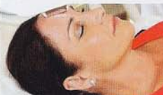
Ultraschallanwendung bei Katerina Jacob

Gewinnen Sie gemeinsam mit Ihrer besten Freundin ein glamouröses Styling mit einer hochwertigen Haarverlängerung im walzchen Promi-Salon. Hinzu kommen zwei Übernachtungen im 5,5-Sterne-Hotel Adlon Kempinski Berlin inkl. Frühstück, Anreise und zwei City Cards Berlin. Klicken Sie für das Styling-Luxus-Wochenende im Wert von 3.000 Euro auf www.gala.de/hairtalk09